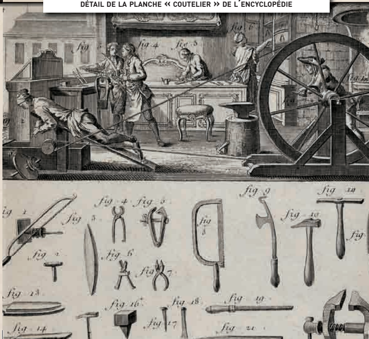
DÉTAIL DE LA PLANCHE « COUTELIER » DE L'ENCYCLOPÉDIE

L'Encyclopédie est la plus importante entreprise éditoriale du XVIII e siècle par la somme de connaissances qu'elle contient et par les moyens matériels nécessaires à sa fabrication. Le parcours de visite présente les 35 volumes originaux de l'Encyclopédie, rendant ainsi hommage aux nombreux contributeurs de cette entreprise magistrale : hommes de lettres, savants, artistes et artisans. Aujourd'hui encore, l'Encyclopédie s'impose comme l'une des plus grandes aventures intellectuelles du continent.