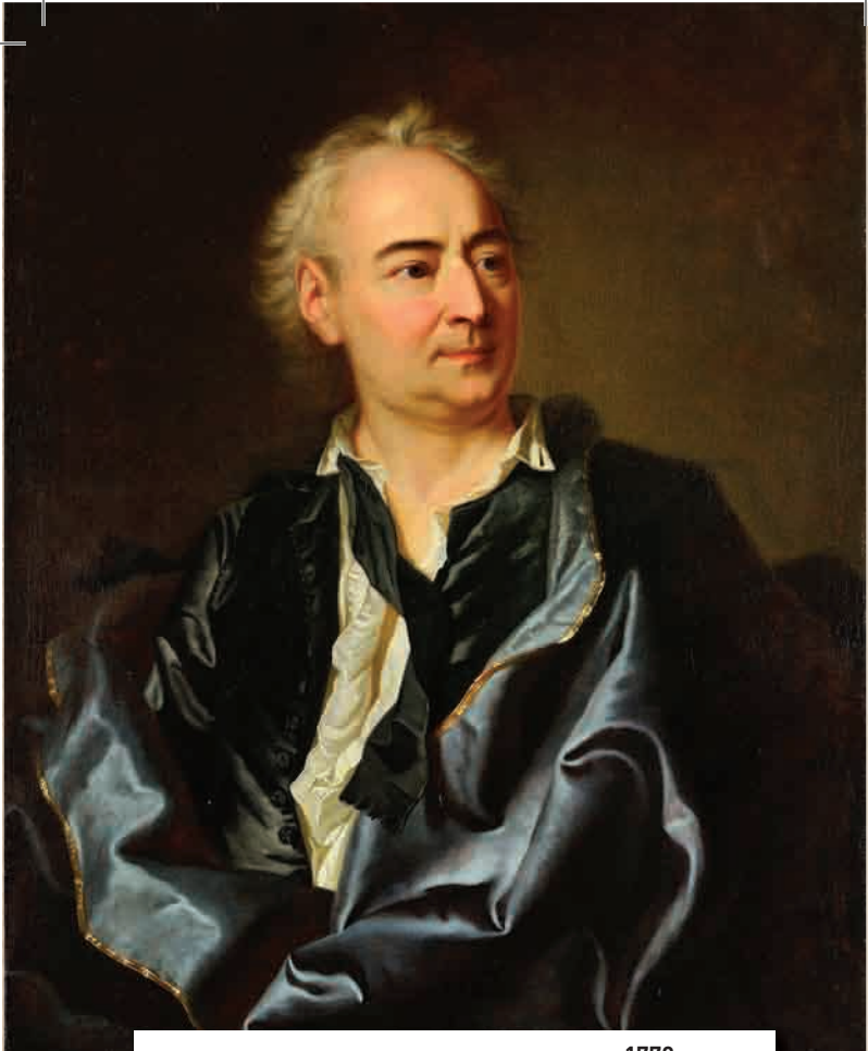
PORTRAIT DE DENIS DIDEROT PAR VAN LOO, VERS 1770