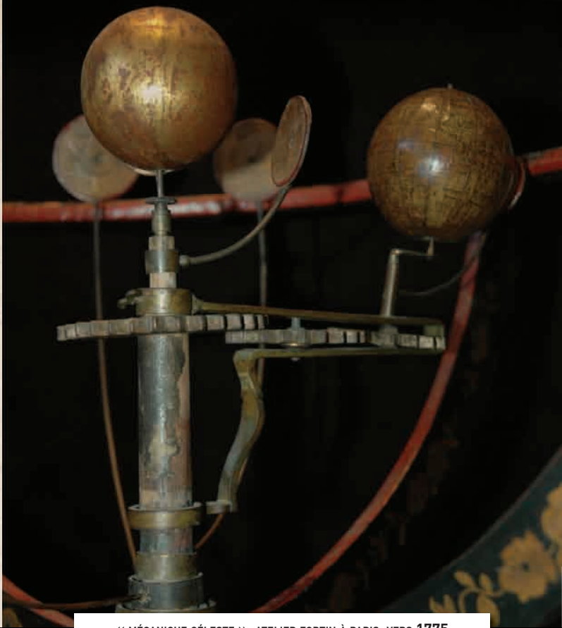
« MÉCANIQUE CÉLESTE », ATELIER FORTIN À PARIS, VERS 1775